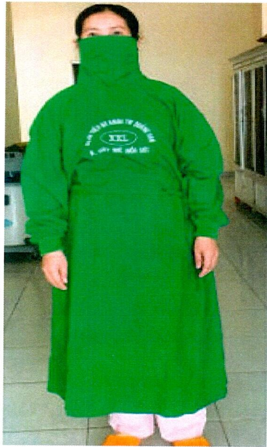
Áo choàng phẫu thuật