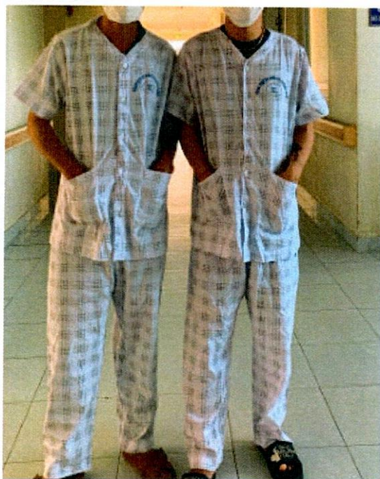
Quần áo người bệnh